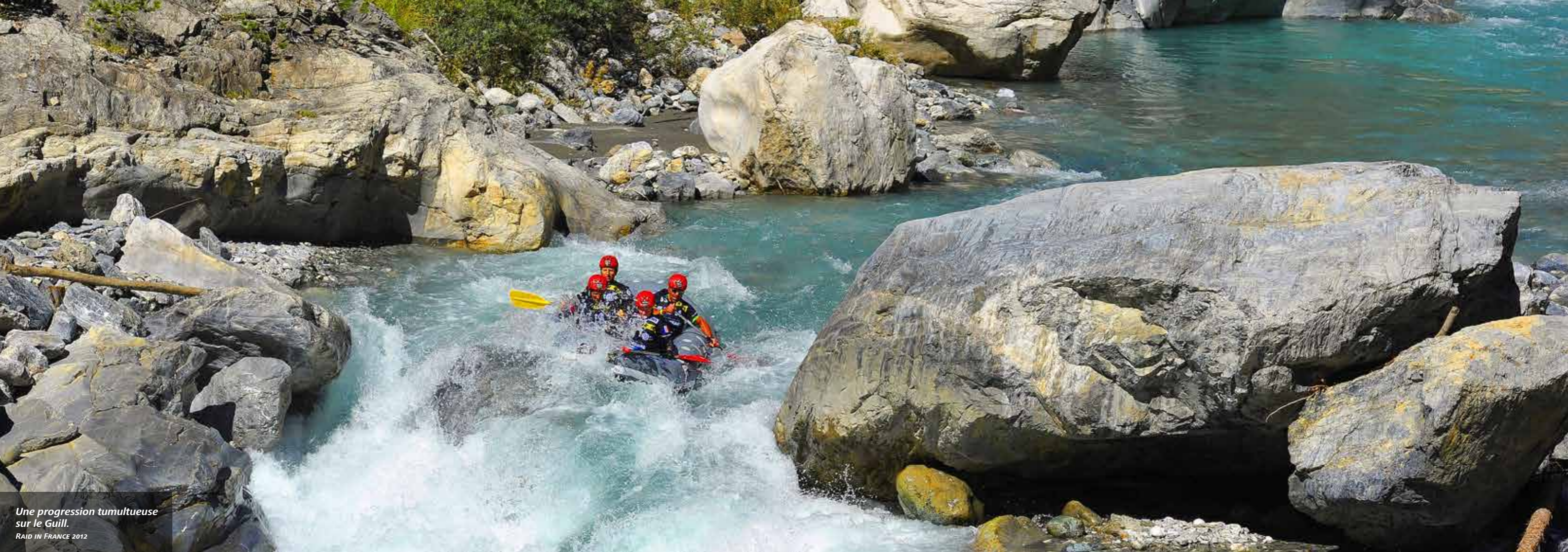
Une progression tumultueuse sur le Guill. RAID IN FRANCE 2012