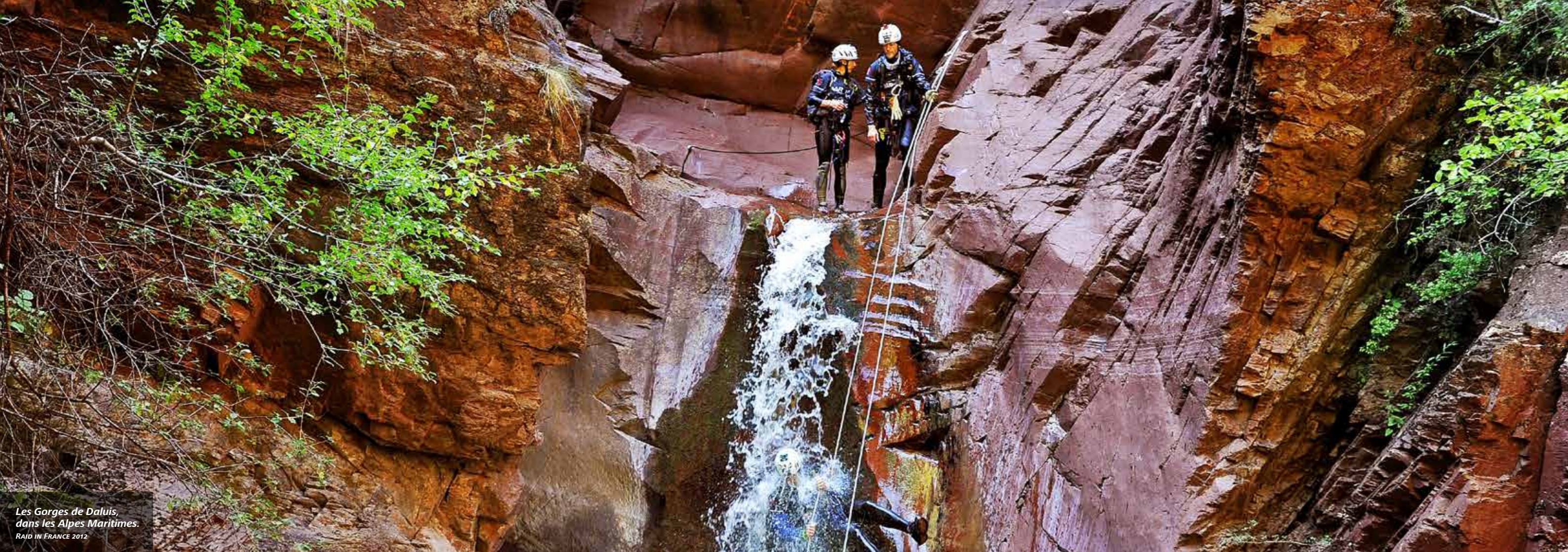
Les Gorges de Daluis, dans les Alpes Maritimes. RAID IN FRANCE 2012