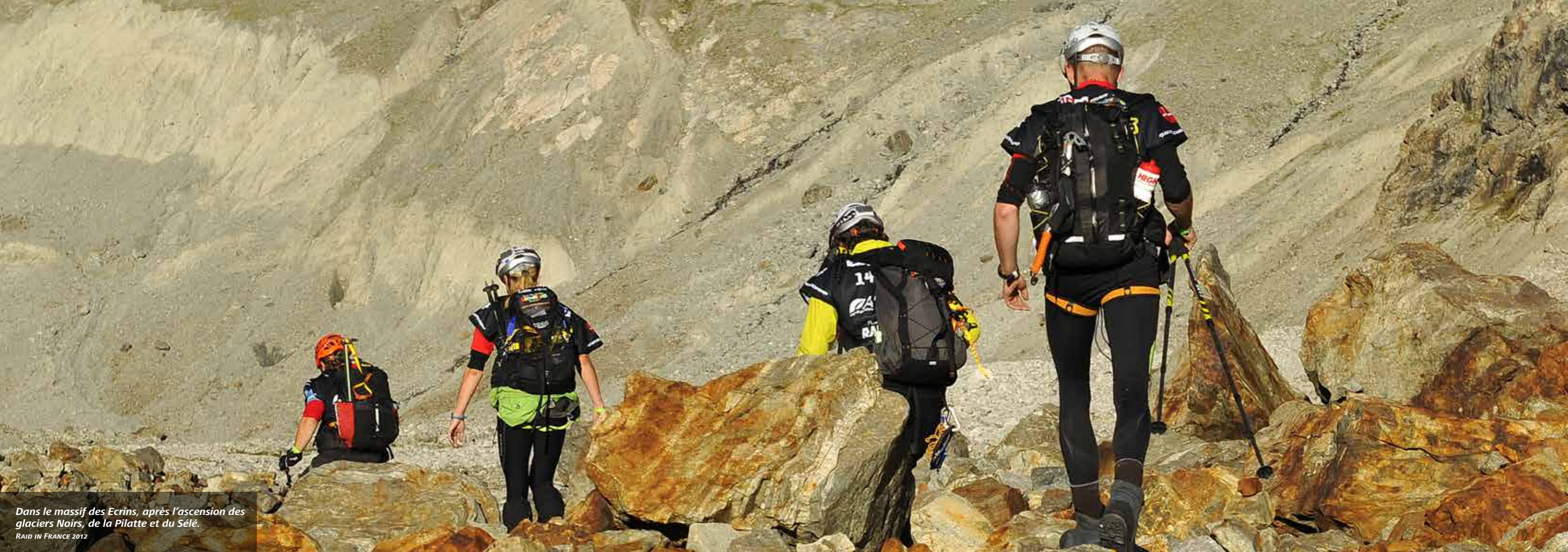
Dans le massif des Ecrins, après l'ascension des glaciers Noirs, de la Pilatte et du Sélé. RAID IN FRANCE 2012