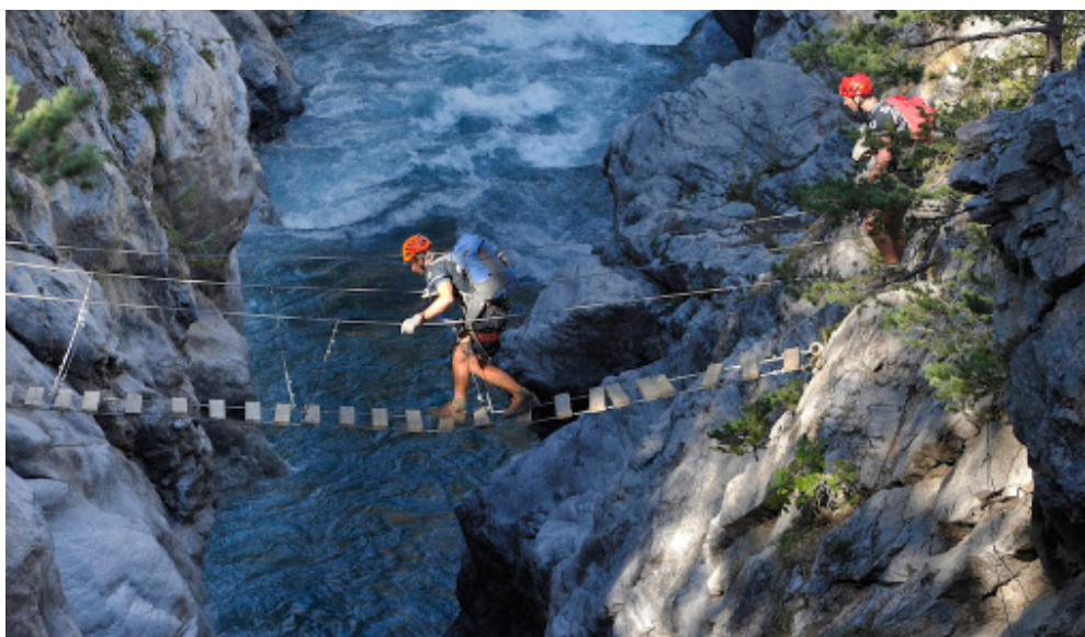
Raid in France 2012