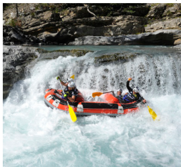
Raid in France 2012