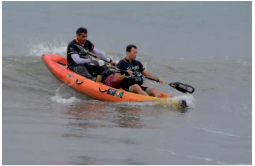
Raid in France 2016